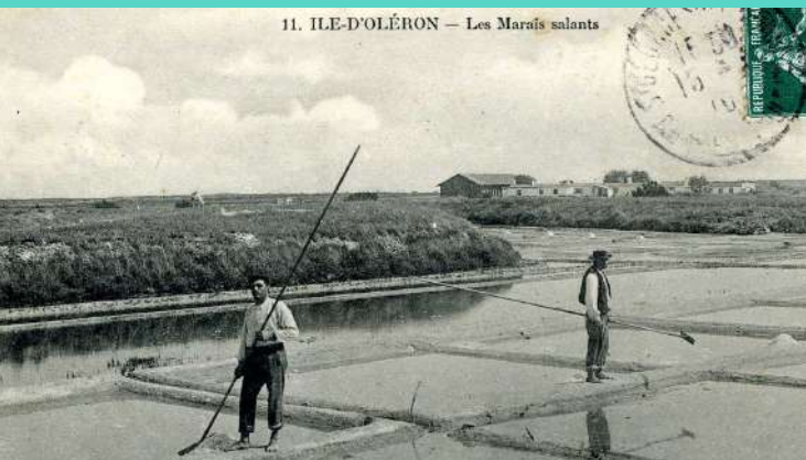
11. ILE-D'OLÉRON — Les Marais salants

Objectifs : Apprendre à travers la narration et le témoignage des images.