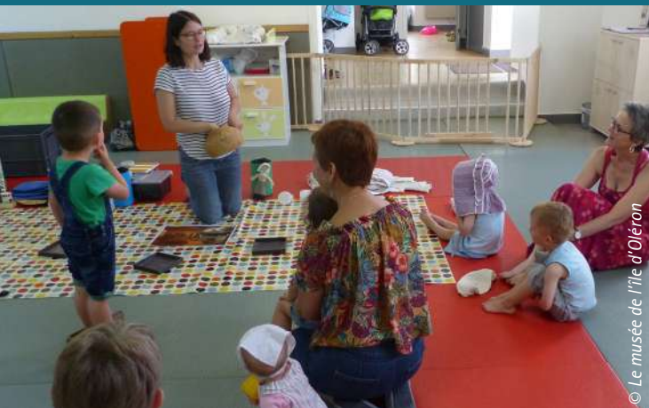
© Le musée de l'île d'Oléron