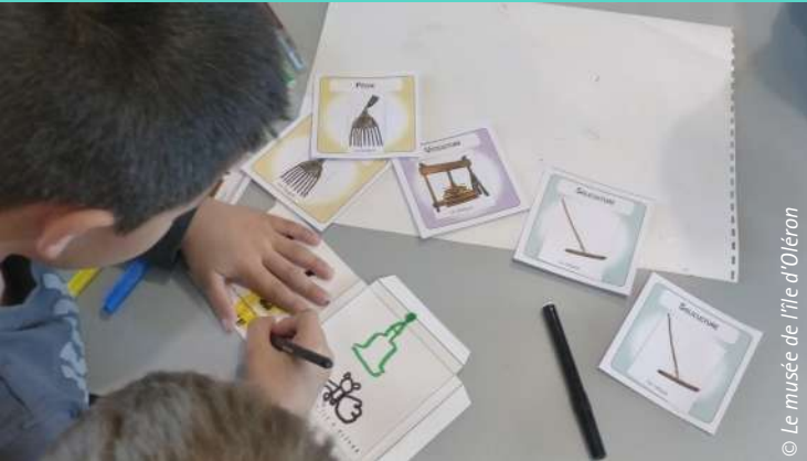
© Le musée de l'île d'Oléron